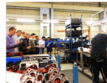
14. KBA Planeta