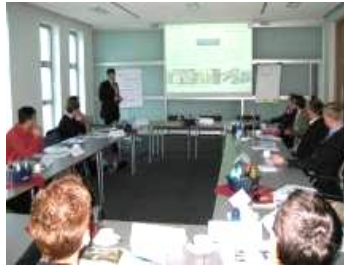
1. KBA Planeta