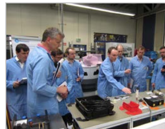
13. AB Elektronik