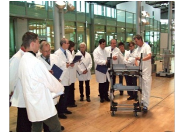
5. Gläserne Manufaktur