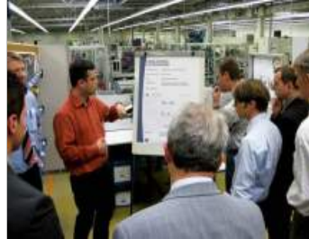
2. AB Elektronik